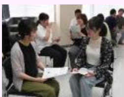
【教育相談の理論と方法】

2年間で3回の研究発表を行います。教育実践研究法の講義と演習を通して、「教育実践研究とは何か?」「リサーチクエスションの立て方」「質的調査と量的調査とは」「先行研究・関連論文の調べ方」「実践の考察」等について段階を踏みながら学び、実習・ゼミ・ラウンドテーブル等を通して研究を進めて行きます。また、生徒や保護者への対応のあり方、様々な危機管理、授業づくり、特別支援教育等に関する理論と実践、子どものケア、法規等を、広く深く学んでいきます。教職大学院全教員で全院生を支援するという理念の下、院生は随時必要に応じて指導教員以外の教員の研究室も訪問し、理解を深めています。