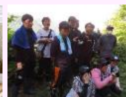
【あおもりの教育Ⅰ(環境)】