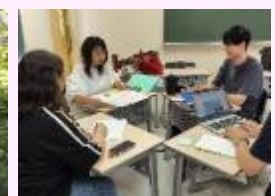
【ポートフォリオ検討会】