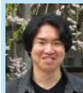
教科領域実践コース

この教職大学院で得た学びを将来に活かすのはもちろん、日々変化する世の中に対応した、柔軟な学びを子どもたちと一緒に創り上げていけるよう、残りの1年を大切に過ごしていきたいです。