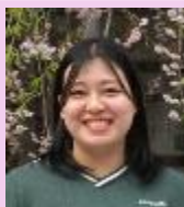
学校教育実践コース

また、専門的知見と実践事例を織り交ぜた本院の教授陣の貴重な講義の数々は、現場にいただけでは得られない視座を与えてくれました。理論と実践を往還し、多角的に教育を捉え直すプロセスは、学ぶことの面白さを再発見させてくれました。説得力が宿ることで子どもたちに伝えたい。そして、子どもたちには楽しんで学んでほしい。だからこそ私自身が「学びの当事者」として楽しみながら学び続けていく。貴重な学びをくれた本院への感謝を胸に、生き生きと働く姿でロールモデルを示していきたいです。この一年の学びを現場に還元し、冒頭の問いに対する「納得解」を得るべく、二年目の実践研究に励みます。