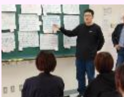
【学校安全と危機管理】