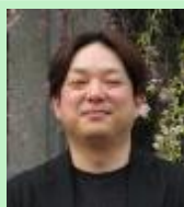
ミドルリーダー養成コース 2年